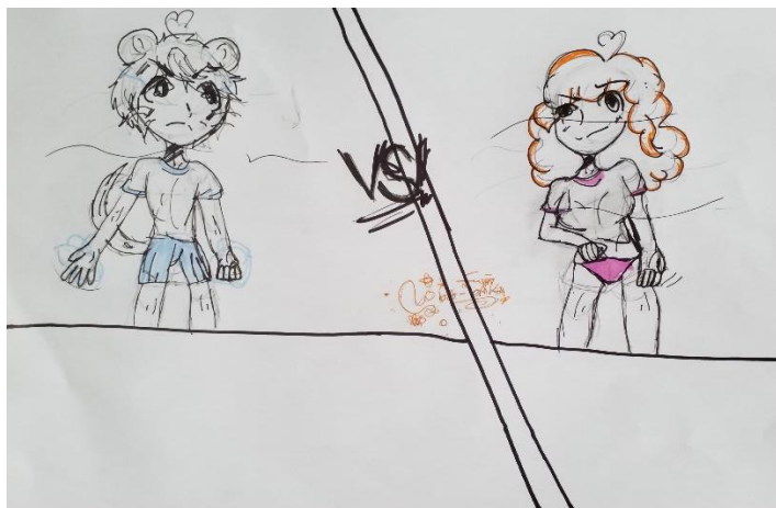
Imagem 4 – Criação do autor

A batalha começa pela Bestie, ela tem o dom de fazer tentáculos da escuridão, ela pega o Stuart de jeito e joga ele de cima pra baixo, ele fica imobilizado, parece que a batalha quase acabou: