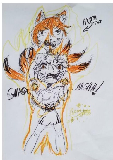
Imagem 6 – Criação do autor

Nós sentimos uma aura tenebrosa, é parece que ainda não acabou, meu caro leitor, prontos para mais uma aventura? ESPERO QUE SIM BORA!!