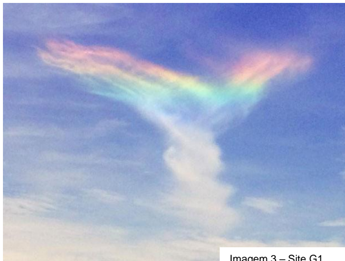
Imagem 3 – Site G1

- Muito bem vocês, vocês já ganharam vários anos mas esse não, pois eu Yuki.... Vou GANHAR quer dizer eu não, NÓS VAMOS!!