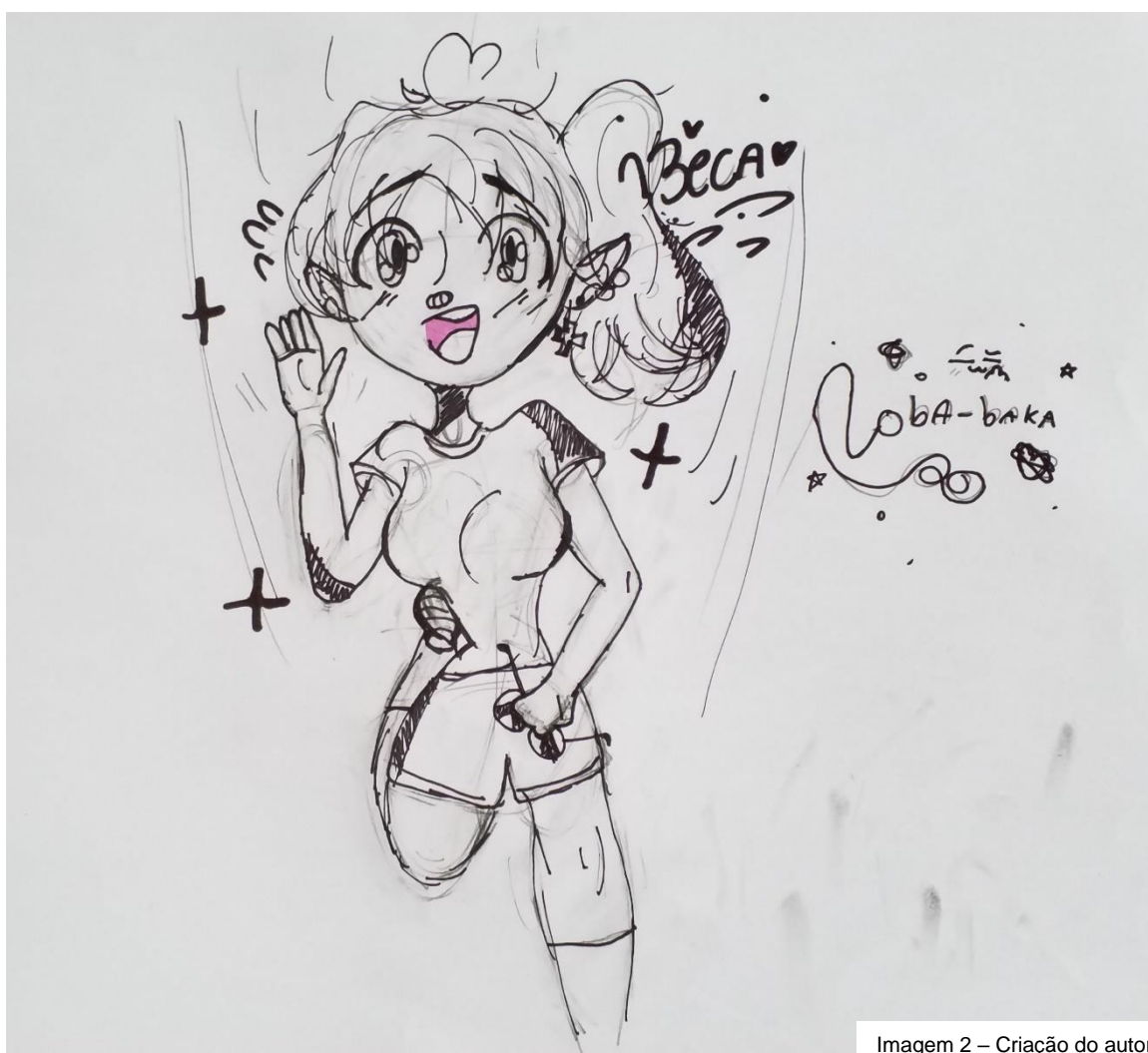
Imagem 2 – Criação do autor

Bom a Beca é uma amiga minha de infância, e depois que nós fizemos 12 anos de idade ela foi pra outro país mas aí ela veio pra cá também! Bom depois o Hawks foi embora falar com o diretor, aí nós fizemos uma sessão de treinamento, cá entre nós eu quase morri lá!! Bom sempre antes do Concurso de Habilidades sempre tem uma semana de feriado, aí nós treinamos e relaxamos.