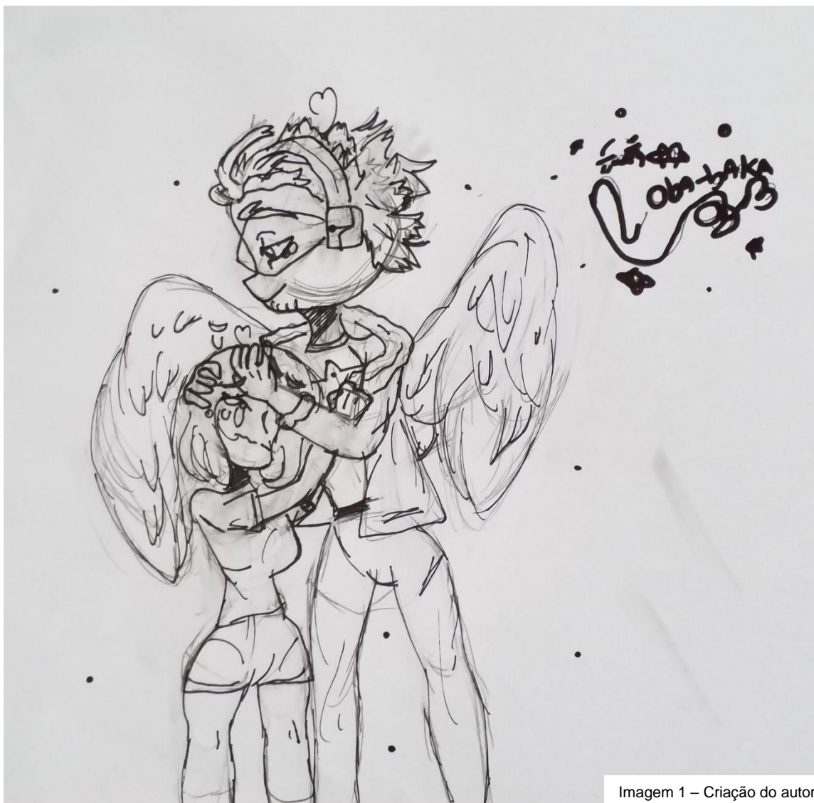
Imagem 1 – Criação do autor

Nesse momento eu corro pra abraçar ele, ele me pega no colo e eu começo a chorar, bom se você não está entendendo absolutamente NADA deixa eu explicar, o Hawks foi como um pai pra mim, basicamente ele foi um eu fui abandonada quando era bebê, e então eu fui criada por ele e pelo Dabi: